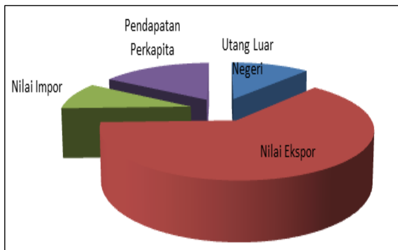
Gambar 2.1 Komposisi Utang Luar Negeri, Nilai Ekspor, Nilai Impor, dan Pendapatan Perkapita Indonesia Tahun 2018 – 2022